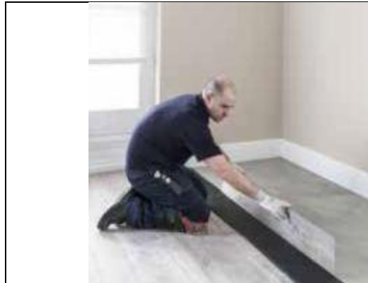
Išrinkite be klijų sudėtas lentas