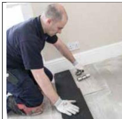
Užtikrinkite tolygų klijų pasiskirstymą

9. Tada klijuoti lentas ir gerai prispausti (galima naudoti volą), siekiant gero klijų pasiskirstymo. Bet koks klijų perteklius turi būti tučtuoju pašalintas drėgna šluoste, niekada nenaudoti valiklio.