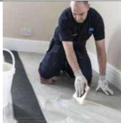
Užtepkite klijus ant pagrindo

8. Palaukti apie 5-10 min kol klijai išsigaruos.