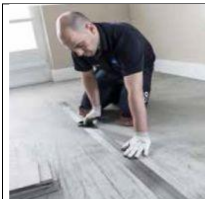
Suraskite centro liniją